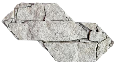
Essence Savana Clara