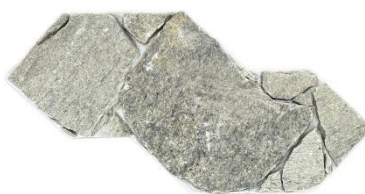
Essence Savana Amazônia