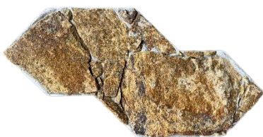
Essence Savana Castanho