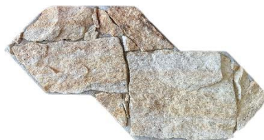
Essence Savana Amarela