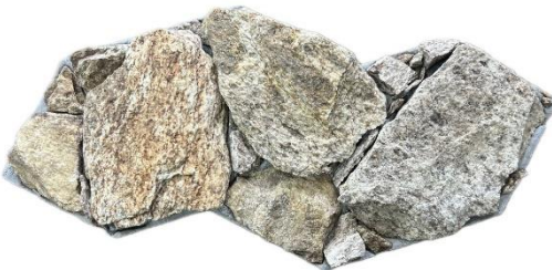
Essence Savana Castanho