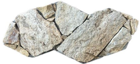
Essence Savana Amarela