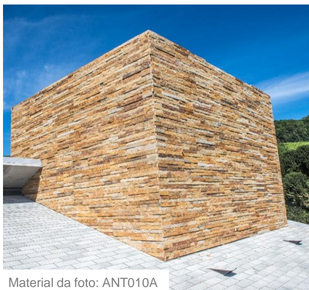
Material da foto: ANT010A