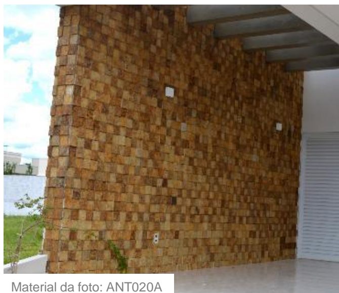
Material da foto: ANT020A