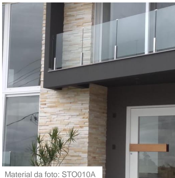
Material da foto: STO010A