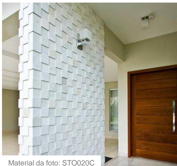
Material da foto: STO020C